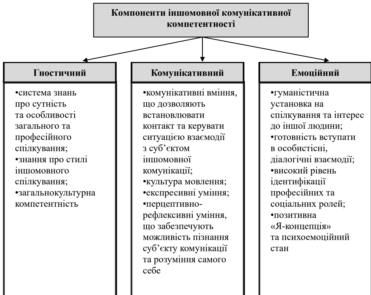
Рис. 1. Компоненти іншомовної комунікативної компетентності

В «Плані заходів щодо формування єдиного індикатора ключових компетентностей» (The European Indicator of Language Competence)