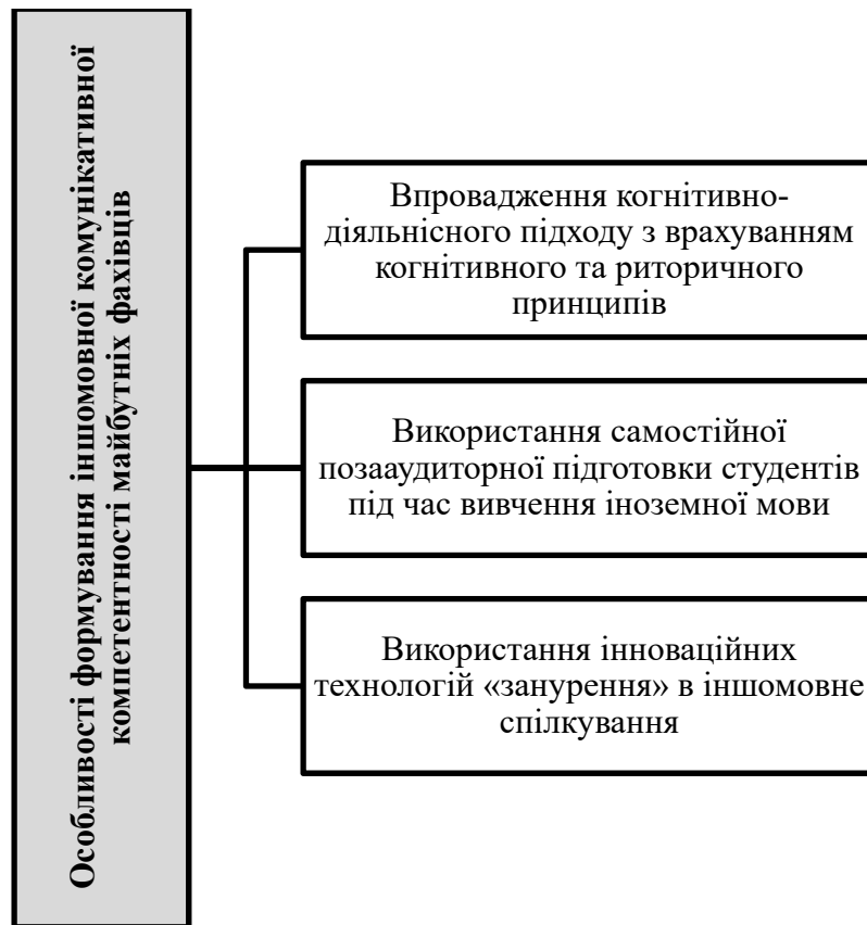
Рис. 3. Особливості формування іншомовної комунікативної компетентності майбутніх фахівців